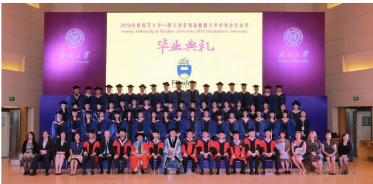
南开大学教育领导与管理硕士-毕业典礼

本项目常年招生，顺次排队。 目前 2024年班级正在报名中 ，各专业均以提交合格报名材料作为报名成功的依据。如有报名意愿，请根据“教育领导与管理专业申请条件及提交材料清单”的相关要求准备报名材料，并提交至邮箱，各专业均以提交合格报名材料作为报名成功的依据。