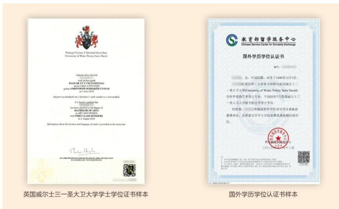
英国威尔士三一圣大卫大学学士学位证书样本

威尔士三一圣大卫大学是中国政府承认的英国公立大学，它于 1893 年按照英国《皇家宪章》成立，2011 年，原威尔士大学、斯旺西城市大学和威尔士大学三一圣大卫学院合并重组为威尔士三一圣大卫大学，合并重组后的大学成为威尔士为国内外学生提供高质量学习和研究机会的重要机构。在 2020 年英国卫报全英大学艺术学科排名中，威尔士三一圣大卫大学位居第五。