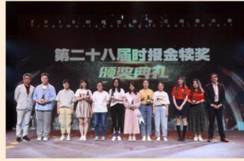
中英艺术本科项目学生荣获“时报金犊奖”双项大奖