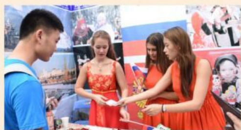
“风行国际”文化节之国际美食展