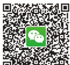
澳科大微信公众号