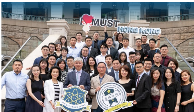
▲ 澳科大校友会活动