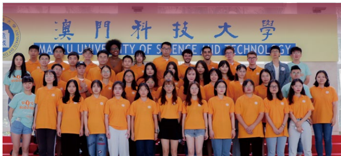
▲ 交换生及国际学院学生大使合照

大学致力于为学生提供更好的国际交流平台。在教育课程、学术研究、人才培养、学生交流等领域，已与欧洲、美洲、澳洲及中国内地、台湾、香港等超过 100 多所教研机构建立了多种形式的合作关系。除此之外，大学亦是亚太大学联合会 (AUAP) 及国际大学联合会 (IAU) 成员。大学为学生提供线上线下的国际交流机会，并设有交换生及交流计划，在读学生可参加长期或短期的出国交流项目。