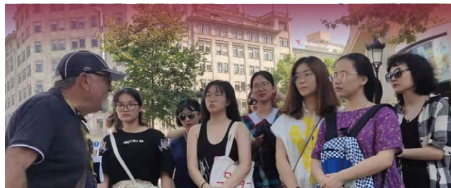
▲ 西班牙巴塞隆纳自治大学暑期项目