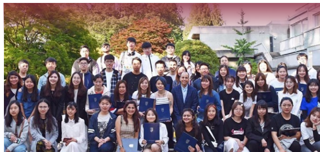
▲ 澳科大与其他海外院校学生参加加拿大英属哥伦比亚大学暑期项目